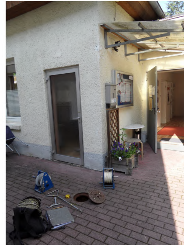
BLP 8, Borkenberg