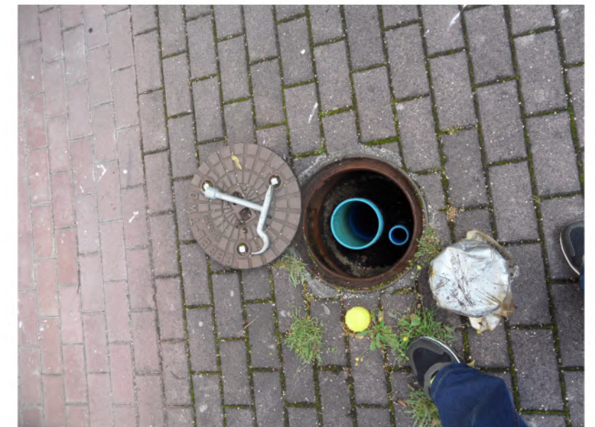
GWM 9, Borkenberg