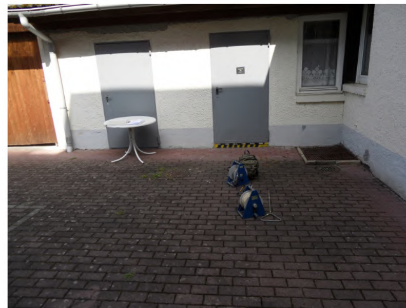
GWM 9, Borkenberg