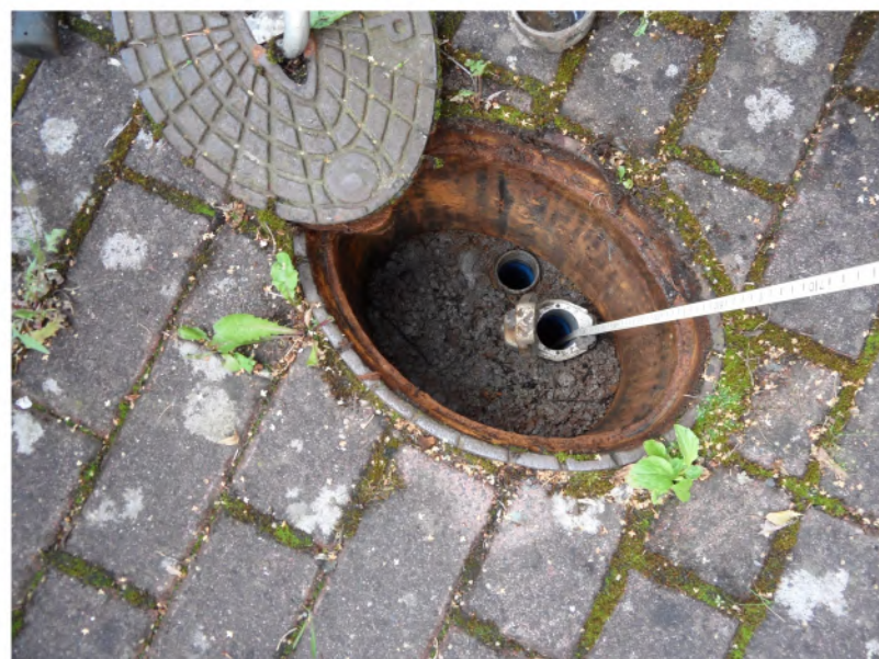
BK 2, Borkenberg