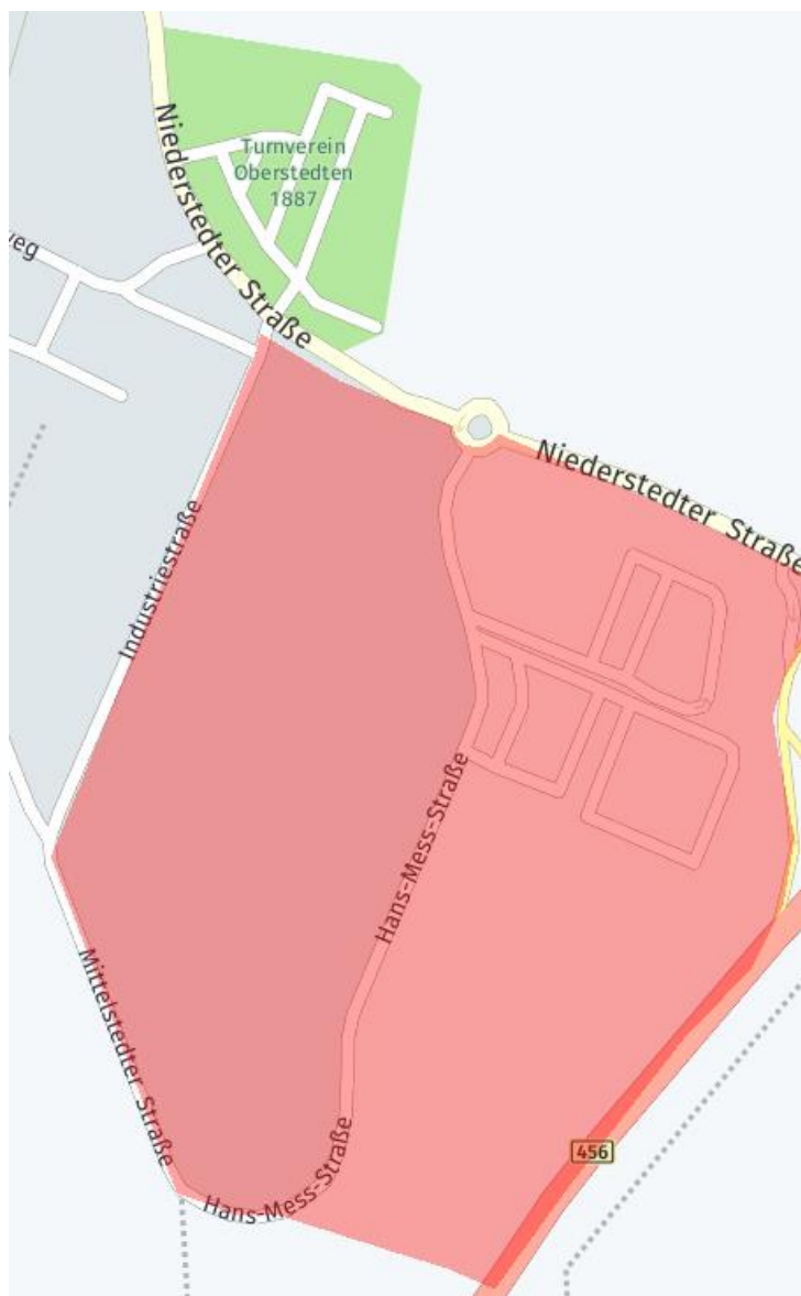
Karte der Stadt Oberursel: Ausbaubereich im Gewerbegebiet entlang der Hans-Mess-Straße