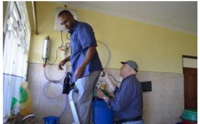
Hilfe bei der Installation in Moshi