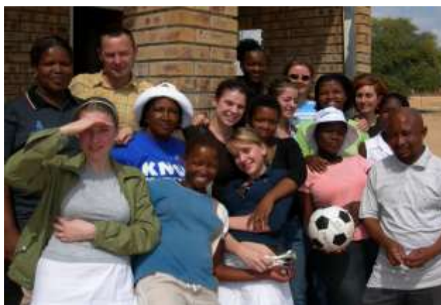
Schüler der FIS besuchen ihr Projekt in der Kalahari in Südafrika