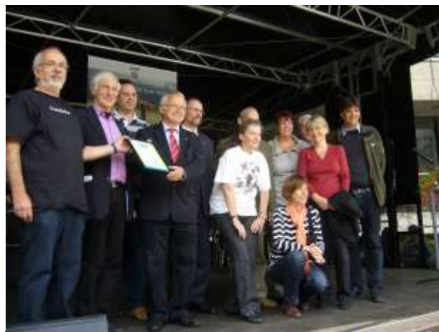
Fair Trade Town 15.09.2012