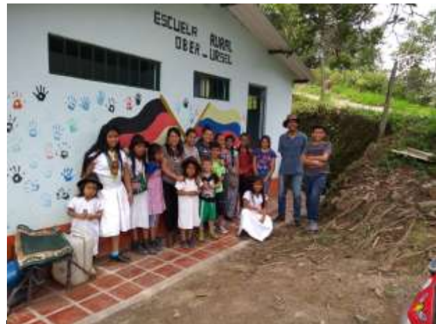
Escuela Rural Oberursel in Sasaima

Dieter Lober-Sies lober.sies@t-online.de und Carsten Bär carbaer@gmx.de