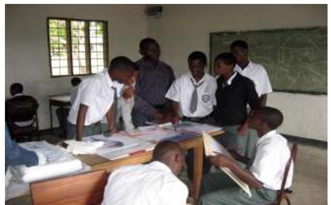
Kunstunterricht an der Fanaka Memorial Sec. School

Barbara Welte/Erhard Henkel Henricusstr. 14 , 61440 Oberursel erhard.henkel@t-online.de www.fanakamemorial.ac (Webseite der Schule)