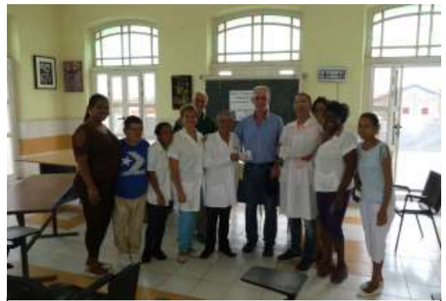
Spendenübergabe 2017 in der Klinik in Cardenas

( www.fgbrdkuba ) und im Netzwerk Cuba ( www.netzwerk-cuba.de )