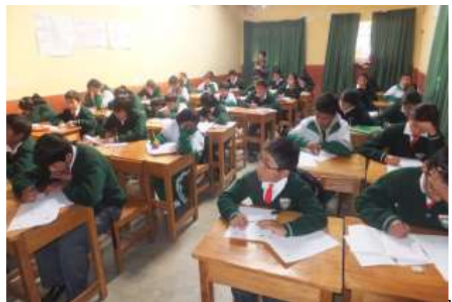
Pfarrschule Maria Arguedas in Puquio