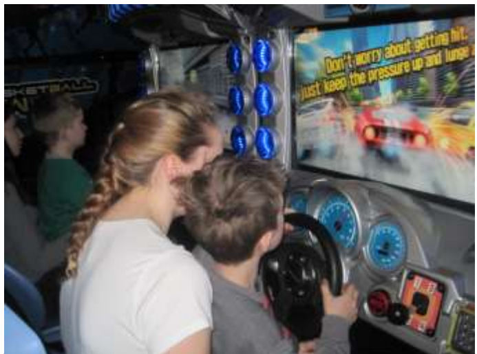
Gemeinsame Unternehmungen bei Besuch von FIS SchülerInnen in Polen

FIS An der Waldlust 15 61440 Oberursel 06171 2024 4430 reception@fis.edu