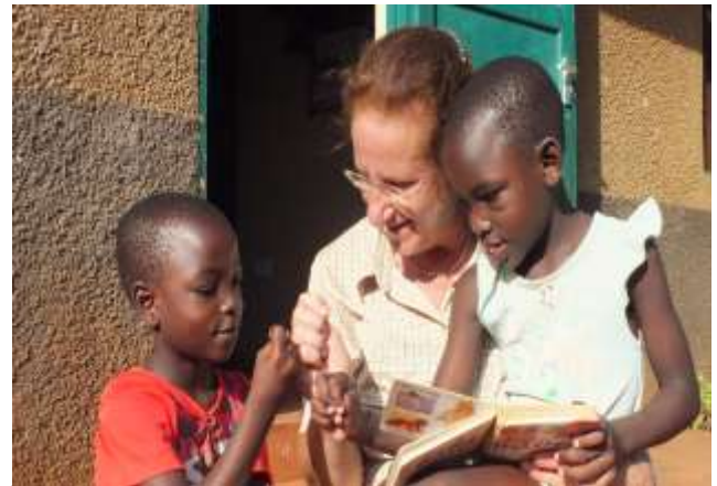
Im Waisenhaus der Kenia Kinder Hilfe

Mathilde Krücke, 1. Vorsitzende Kurmainzer Str. 124 61440 Oberursel 06171-981546 oder 01525-3423355 mathi.kruecke@kenia-kinder-hilfe.de