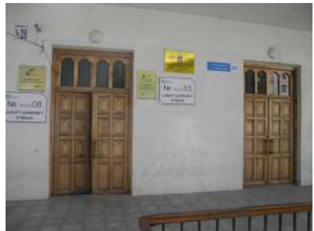
Eingangstür Gymnasium in Tiflis