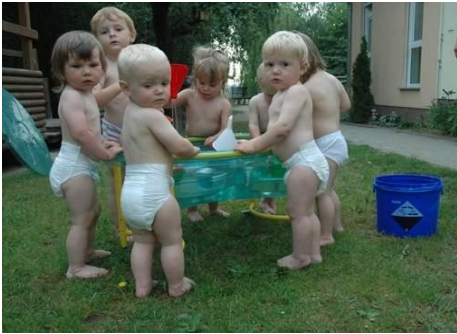
...Windeln im Gesicht???